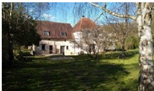
La maison d'hôtes

Charmante propriété, à 30 km d'Angers, au sein de 2 ha de campagne arborée.